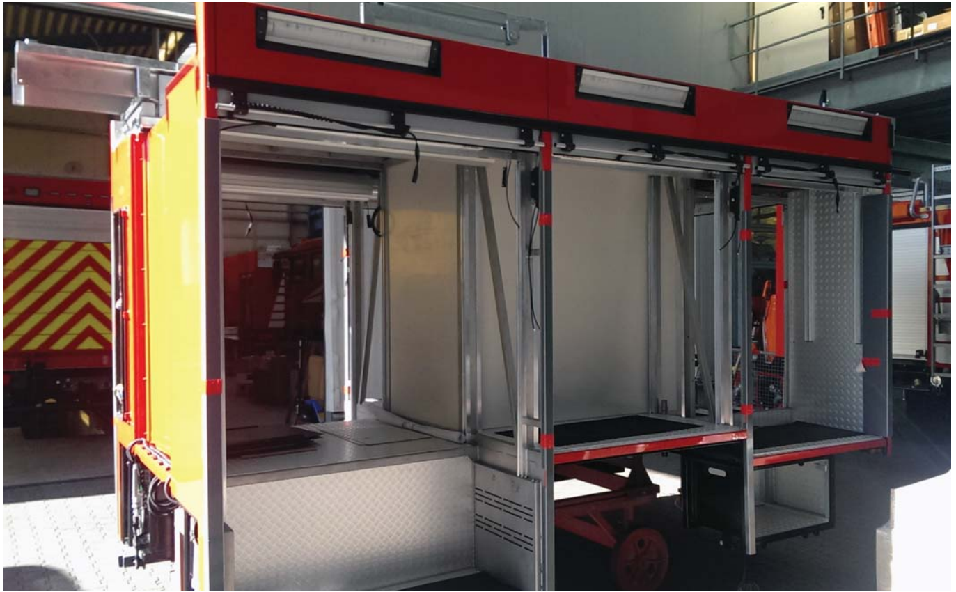
So sieht der „hintere Teil“ des künftigen Löschfahrzeugs momentan noch aus. Unten das Fahrgestell.

Bau hat begonnen – Ausrüstungsteile nach Niedersachsen gebracht