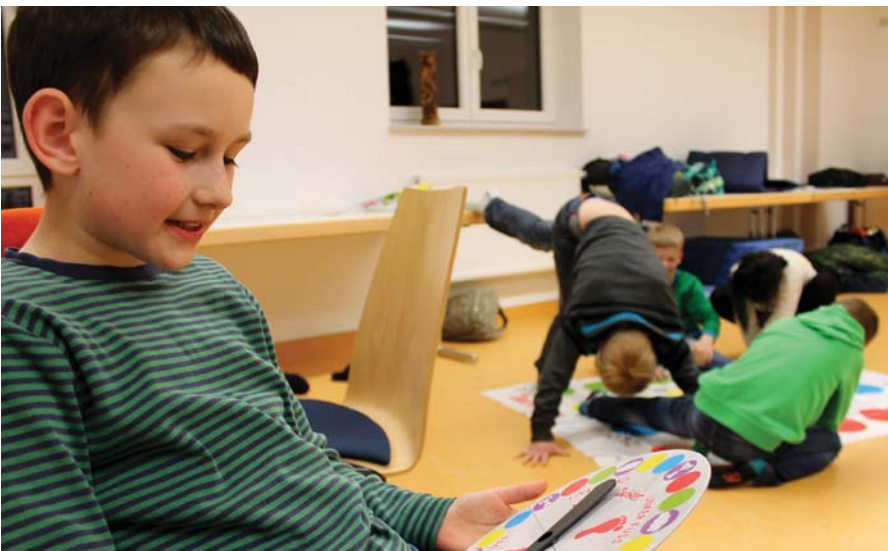
Fast verknottet haben sich die Kinder, hier ein Teil beim Spiel „Twister“.

Kirchehrenbach Fast genau ein Jahr nach der ersten Übernachtung der Feuerwehr-Wichtel im Gerätehaus fand letztes Wochenende der „zweite Streich“ statt. Schon 2014 stand für die jüngsten