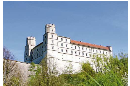
Die Willibaldsburg.