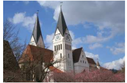
Der Dom.