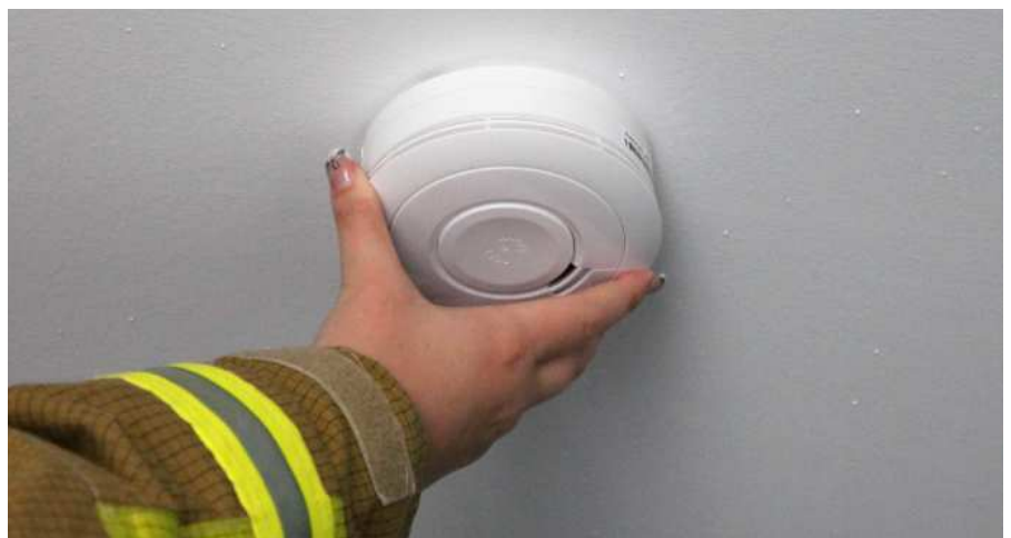
Sind einfach an der Decke zu montieren und retten Leben: Rauchmelder.

geachtet werden. Seit einiger Zeit gibt es das Qualitätszeichen „Q“. Es verspricht erhöhte Stabilität, geprüfte Langlebigkeit und eine fest eingebaute Batterie mit mindestens zehn Jahren Lebensdauer. Je nach Typ lassen sie sich auch per Funk verbinden.