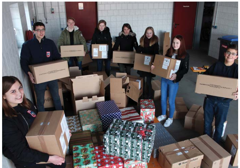
Wie in einer Paketstation sah es in der Waschhalle aus.

Kirchehrenbach Im siebten Jahr in Folge hat die Jugendfeuerwehr wieder eine zentrale Sammelstelle für Pakete für die Weihnachtstrucker-Aktion der Johanniter Bayern im Feuerwehrhaus eingerichtet. Aus der Bevölkerung wurden insgesamt 53 Päckchen für die ärmsten Familien in Osteuropa – gefüllt mit Zahnbürsten, Nudeln, Zucker und vielen anderen Dingen des täglichen Gebrauchs – abgegeben. Die Zahl ist damit leicht gesunken (2015: 63). Wieder angeboten wurde auch der spezielle Pack-Service: Gegen den entsprechenden Geldbetrag stellten