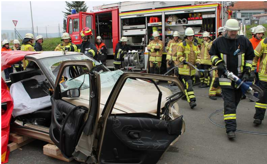
Verschiedene Möglichkeiten an den Patienten heranzukommen wurden trainiert.