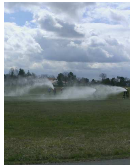
Auch die Feuerwehr Neunkirchen am Brand war an der „Wasserwand“ beteiligt.

Kersbach Eine großangelegte Katastrophenschutz-Übung fand am Samstag, 13. April, am Kersbacher Bahnhof statt. Ein mit gefährlichen Stoffen beladener Güterzug war entgleist und gegen die Brücke geprallt. Über 400 Einsatzkräfte von Feuerwehr, THW, Rettungsdiensten und dem Krisenstab des Landratsamtes waren gefordert. Am späten Vormittag wurde der Katastrophenfall festgestellt. Unter den rund 50 Feuerwehren - darunter Kräfte aus Erlangen und Bamberg - war auch ein Löschfahrzeug mit neun Einsatzkräften aus Kirchhehrenbach. Sie mussten mit weiteren Wehren eine Richtung Kersbach ziehende Giftwolke mit mehreren Löschrohren niederschlagen. smü