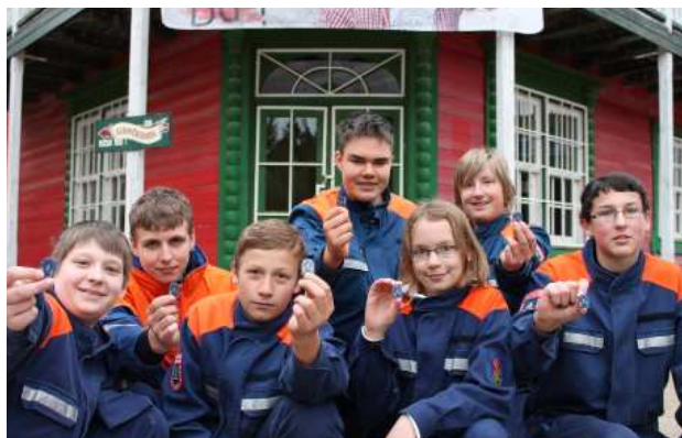
Der Kirchrehnbacher Nachwuchs war erfolgreich.

Heroldsbach/Thurn Mit viel Spaß aber dem nötigen Ernst haben 225 Jugendliche aus dem Landkreis Forchheim – darunter sieben Kirchrehnbacher – den Leistungsnachweis Jugendflamme in verschiedenen Stufen absolviert. Wieder konnte dafür, bei laufendem Betrieb am Samstagnachmittag, das Gelände des Freizeitparks Schloss Thurn genutzt werden.