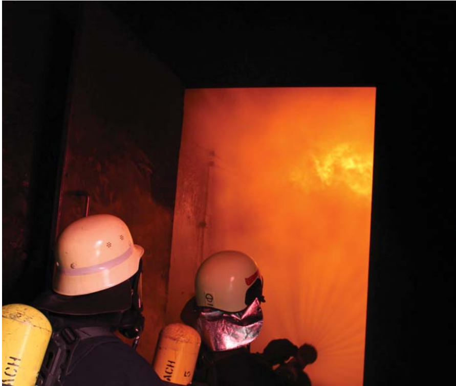
Ab in die Flammen: Zwei Kirchehrenbacher gehen gerade vor.

Nürnberg Beim sog. Innenangriff, also der Brandbekämpfung in Gebäuden, können auf die Einsatzkräfte schnell Temperaturen von mehreren hundert Grad zukommen. Um sich an diese ungewöhnliche Wärme zu gewöhnen und auch das grundlegende Vorgehen zu trainieren, waren acht Atemschutzgeräteträger zu Gast bei der Berufsfeuerwehr (BF) Nürnberg. Dort